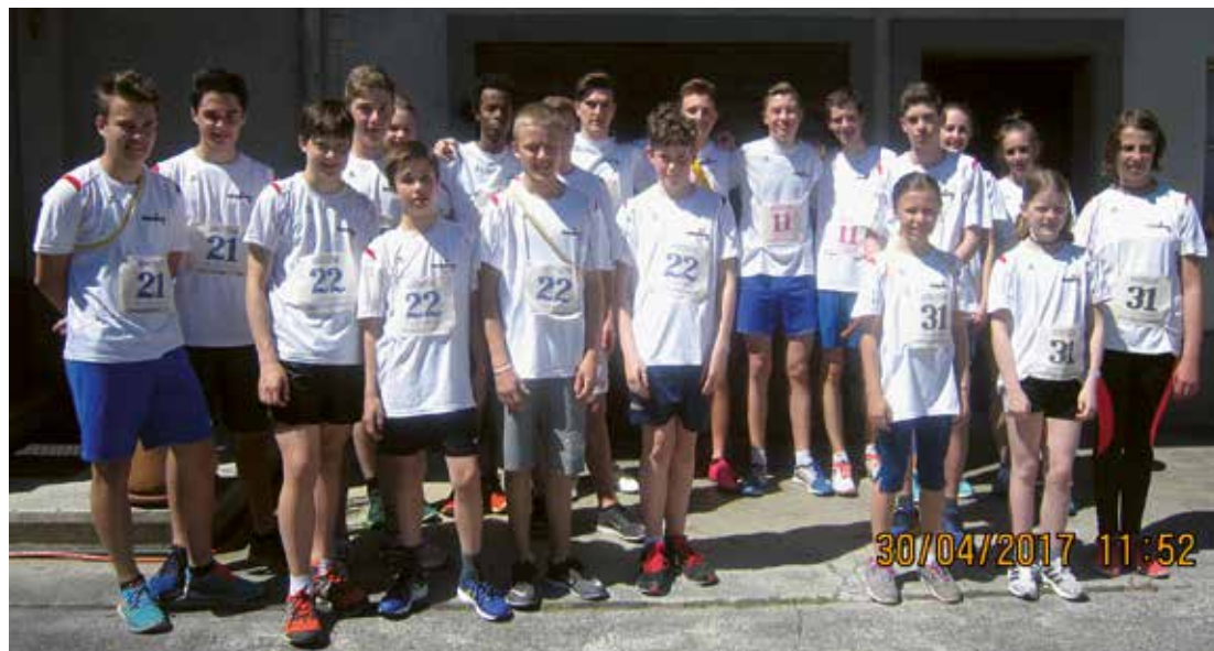
Die 4 J+S-Mannschaften vor dem Start zum Schulfest-Cup 2017

Knaben sind diese Aufbauphasen schon in den letzten Jahren ausgeführt worden. (In den letzten drei Jahren haben wir jede besuchte Stafette in der Jugendkategorie gewonnen.) In der Jugend 1 (17 – 20-jährig) konnte der Sieg vom letzten Jahr wiederholt werden. Dazu konnte die Laufzeit um 10 Sekunden verbessert werden. Im Jugend 2 konnte der letztjährige Sieg auch wiederholt werden und die Laufzeit wurde auch hier um 14 Sekunden verbessert. Die zweite Gruppe in dieser Kategorie konnte ihre Laufzeit vom letzten Jahr um 15 Sekunden verbessern, was ihnen den zweiten Rang in der Jugendkategorie 2 einbrachte. Dieser Doppelsieg war eine sehr gute Leistung der gesamten J+S-Riege.