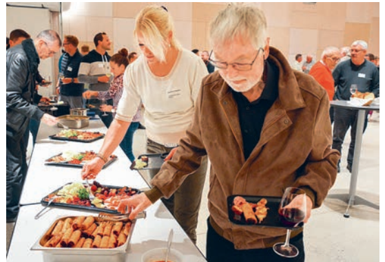
Zahlreiche Gewerbetreibende genossen den Apéro und die interessanten Begegnungen.

sind. Der Vortrag schlug eine Brücke zwischen Wirtschaft und Kultur. Er zeigte, wie die Töpfertradition Heimbergs über Jahrhunderte hinweg das Dorf prägte und bis heute Identität stiftet. Für die Gäste des Wirtschaftsapéros war es eine eindrückliche Erinnerung daran, dass wirtschaftlicher Erfolg und kulturelles Erbe Hand in Hand gehen können. sku