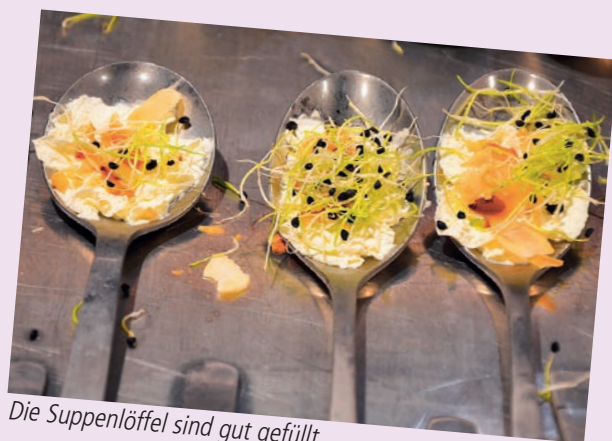
Die Suppenlöffel sind gut gefüllt.