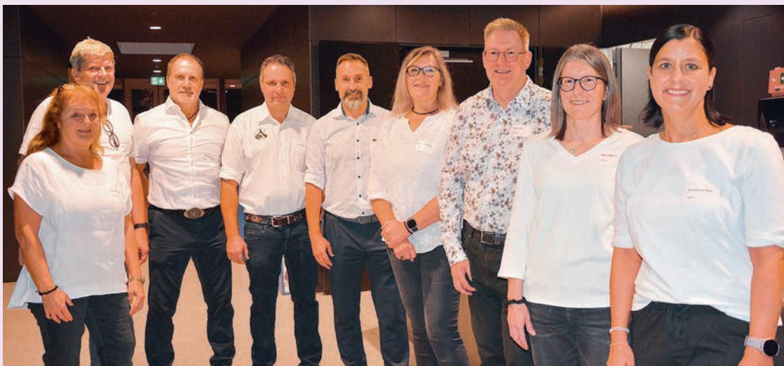
Mitglieder des Gemeinderates wie auch Mitarbeitende der Verwaltung waren für den Service besorgt.