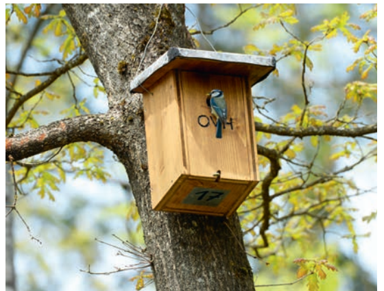
Meisen füttern ihre Jungen bis zu deren Selbstständigkeit zum grössten Teil mit Raupen.