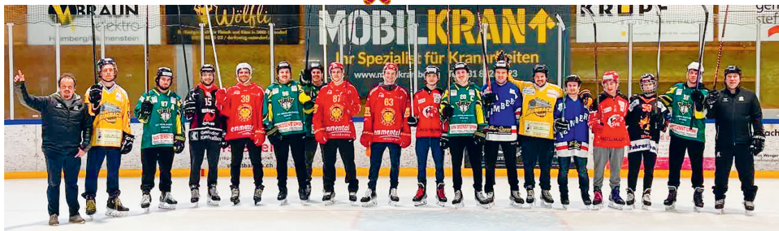
Am Swiss Ice Hockey Day waren einige NLA-Spieler der SCL Tigers und anderen Mannschaften auf dem Eis in der Hot Shot Arena.