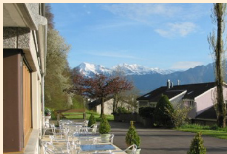
Aussicht Wohnhaus Niesen