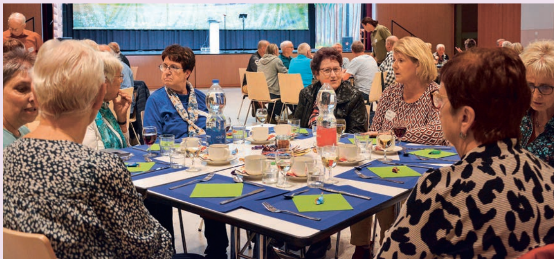
Engagierte Bürgerinnen und Bürger konnten sich in der Aula auf ein feines Nachtessen freuen.