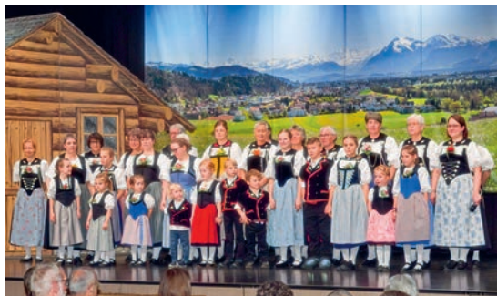
Die Trachtengruppe und die Kindertanzgruppe Heimberg bescherten dem Publikum abwechslungsreiche Unterhaltungskonzerte.

Am Wochenende vom 15. und 16. November durfte die Trachtengruppe Heimberg die jährlichen Unterhaltungskonzerte durchführen. Die Aula war an beiden Tagen sehr gut gefüllt, was die Vereinsmitglieder ausserordentlich freute. Mit leuchtenden Augen durfte die Kindertanzgruppe die Konzerte jeweils eröffnen. Abwechselnd zeigten die Sing- und Tanzgruppe ihr Erlerntes. Wie jedes Jahr durfte die Trachtengruppe Gäste empfangen. Am Samstag waren es die Spycherliodler Eggwiwi und am Sonntag die Turmjutzer «vo hie u dert». Beide Gäste wussten zu überzeugen. Etliche positive Rückmeldungen bestätigten diesen Eindruck. Die Tombola und das reich gefüllte Kuchenbuffet wurden ebenfalls geschätzt. Ein grosser Dank geht an die zahlreichen fleissigen Helfer. Sie bescherten den Zuschauenden und Aktiven einen ruhigen Anlass. Die Aktiven durften etwas Zeit mit dem Publikum verbringen. Dies genossen sie sehr und es zeigte, wie wichtig der persönliche Austausch ist. Die Trachtengruppe Heimberg wünscht allen Freunden, Bekannten, Sponsoren, Ehren- und Passivmitgliedern eine besinnliche Adventszeit.