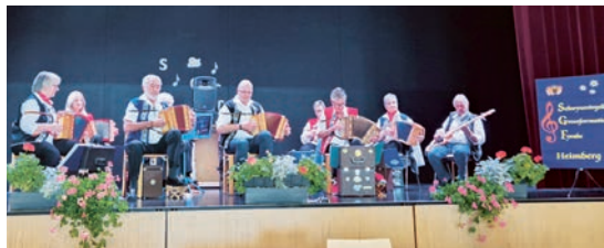
Die Schwyzerörgeli Grossformation Fyrabe feierte am Seniorenachmittag ihr 25-jähriges Bestehen.