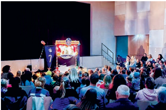
Rund 200 Personen besuchten das Kasperlitheater des Elternvereins.