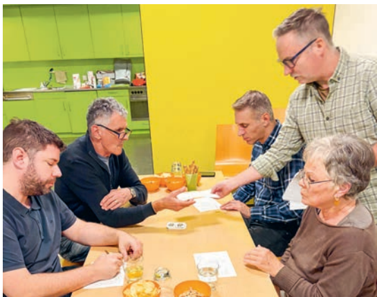
Am Jass des Leist Untere Au wurden Karten gemischt, Trümpfe angesagt und Stiche gezählt.

Ein gemütlicher Abend stand ganz im Zeichen des Jassens. Vier leidenschaftliche Spieler am Tisch und drei Zuschauer trafen sich zum Jass des Leist Untere Au. In geselliger Runde wurden Karten gemischt, Trümpfe angesagt und Stiche gezählt. Immer begleitet von heiteren Sprüchen und herzhaftem Lachen. Die Stimmung war von Anfang an entspannt und freundlich. Niemand nahm das Spiel zu verbissen, der Spass stand klar im Vordergrund. Am Ende des Abends zählte weniger wer gewonnen hatte, sondern vielmehr das gemeinsame Erlebnis. Der Leist-Jass zeigte einmal mehr, wie schön es ist, in guter Gesellschaft ein paar unbeschwerte Stunden zu verbringen. Vielen Dank allen die dazu beigetragen haben.