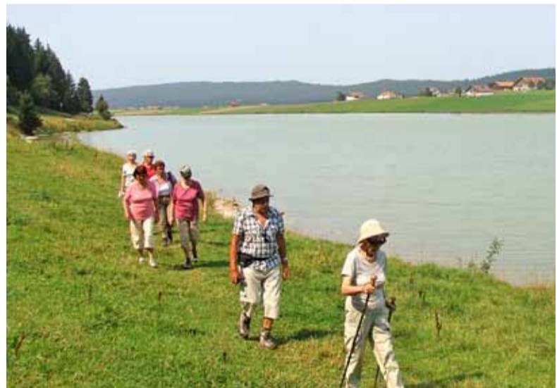
Verträumte Juralandschaft am Lac des Taillères.

Der Car startete mit lediglich zwei freien Plätzen ab Steffisburg/Heimberg über Bern nach Neuenburg. Von hier aus waren die Route und die Landschaft für die Mehrheit der Teilnehmenden eher unbekannt. Über den Col de la Tourne, dann quer durch das liebliche Hochtal «Vallée des Ponts» nach Le Locle und weiter zum Kaffeehalt in La Brévine. Der heisse August-Tag liess von der im Winter als kälteste Gegend der Schweiz nichts erahnen. Bei einer ersten kurzen Wanderung am Lac des Taillères, abgelegen am äussersten Rande der Schweiz, konnte man ein Stück melancholisch anmutende und stille Landschaft geniessen. Der See wird vorwiegend durch Regenwasser und einzelne Quellen im See selbst gespeist. Auch der Abfluss geschieht unterirdisch. Nach der Rückfahrt nach Fleurier war Mittagspause unter schattenspendenden Bäumen im Park angesagt. Die nächste Etappe war «Chapeau de Napoléon», ein Aussichtspunkt mit Restaurant. Es bestand die Möglichkeit, entweder kurz nach St. Sulpice den Car zu verlassen und auf dem Wanderweg den Felsvorsprung rund 200 Meter über der Talebene mit der einzigartigen Panorama-Sicht auf das gesamte Val de Travers zu erklimmen oder ganz hinaufzufahren. Einige wagten dann auch den etwas steileren Abstieg nach Fleurier, darunter sogar eine 88-Jährige. Schliesslich führte die Reise über Ste. Croix – Yverdon – Bern nach Hause. pw