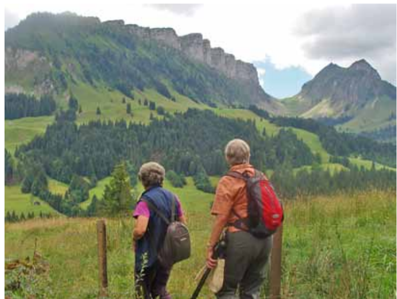
Blick zu den Sieben Hengsten und der Sichel.

Ausgangspunkt und Ziel waren für beide Gruppen die Bushaltestelle Innereriz Säge. Die eine wählte den Wanderweg mit steilem Anstieg zum Picknick-Platz beim Punkt 1200 m.ü.M., die andere in gemütlicherem Tempo den Fahrweg über Trüschhubel. Beim Eintreffen der zweiten Gruppe beendete die erste bereits ihre Mittagsrast und stieg weiter bis zur Oberen Breitwang hinauf. Ab hier führte der Bergweg, der eher als ein von Kühen am Hang ausgetretener Alpweidenweg bezeichnet werden könnte, am Fusse des Trogenhorns in Richtung Wimmisalp. Die markanten Sieben Hengste samt der Sichel und die Aussicht über das Eriz wurden immer wieder bestaunt werden. Nach dem Aufstieg von insgesamt rund 400 Metern ging's ebenso viele Meter wieder abwärts und zwar über das Rotmoos. Die zweite Gruppe wanderte vom Picknick-Platz aus ebenen Weges direkt zum Rotmoos. Das geschützte Hochmoor ist von nationaler Bedeutung, landschaftlich ein Leckerbissen in paradiesischer Ruhe. Von hier aus führte der Weg über den Chaltbach ins Tal hinunter. pw