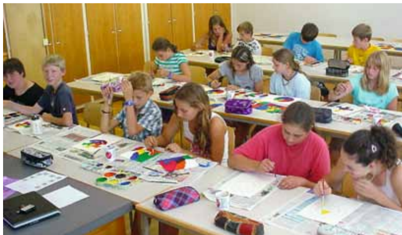
Ab Sommer 2013 werden alle Oberstufenschüler der rechten Zulage gemeinsam in Unterlangenegg unterrichtet.

Die Kommission ist überzeugt, dass mit dem Schulmodells 3b sowohl pädagogisch, wie auch punkto Schulorganisation, den Bedürfnissen von Schülerinnen und Schülern, Lehrkräften und auch den Eltern am besten entsprochen werden kann. Auf der anderen Seite können auch die Klassengrößen in jeder Beziehung optimal gestaltet werden, was ebenfalls allen Beteiligten – und zwar letztlich auch den Steuerzahlern – zu Gute kommt. Denn mit dem neuen Finanz- und Lastenausgleich (Filag), der seit diesem Jahr in Kraft ist, setzt der Kanton starke finanzielle Anreize, um die Klassengrößen zu optimieren. Damit der Schulbetrieb als integriertes OSZ mit allen Real- und Sekundarschülern aus den Verbandsgemeinden Buchholterberg, Eriz, Fahrni, Oberlangenegg, Unterlangenegg und Wachseldorn im August 2013 aufgenommen werden kann, sind bauliche Sanierungen und Erweiterungsbauten unerlässlich. Das konkrete Bauprojekt inklusive Kosten wird am 18. (in Heimenschwand) und am 20. September (in Oberlangenegg) der Bevölkerung vorgestellt. Die Bürgerinnen und Bürger der 6 Verbandsgemeinden haben die Möglichkeit, an ausserordentlichen Gemeindeversammlungen am 18. und 19. Oktober über den entsprechenden Baukredit abzustimmen.