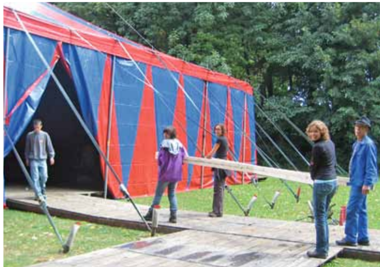
Mann- und Frauenpower beim Zeltaufbau im Schadaupark.

Weitere Informationen und Tickets: www.maerchenhaft.ch