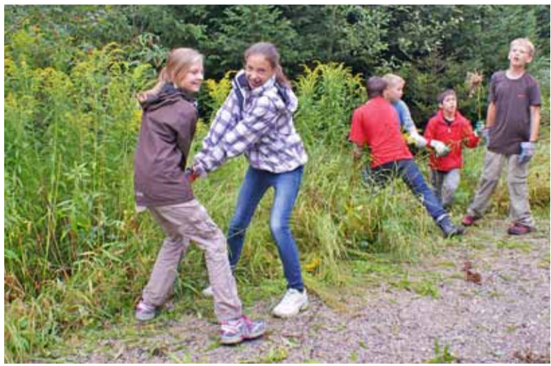
Den Kindern von der Schule Au hat der Naturschutzeinsatz sehr gefallen und sie möchten weiter helfen, den Hartlisberg von den invasiven Pflanzen zu befreien.

Jährlich investieren Kantone, Gemeinden und Naturschutzorganisationen über 200 Millionen Franken, um invasive Neophyten aus ökologisch wertvollen Lebensräumen zu entfernen. Es sieht fast nach Sisyphusarbeit aus, wenn man bedenkt, in wie vielen Gärten diese Pflanzen noch ungestört gedeihen. Die Kanadische Goldrute mag sehr dekorativ aussehen, doch jeder ihrer Stängel produziert ca. 19'000 Samen, die kilometerweit vom Wind transportiert werden. In ihrer nordamerikanischen Heimat gibt es etwa 290 Insektenarten die sie fressen, bei uns hat sie keine Feinde. Deswegen soll man sie aus dem Garten entfernen oder mindestens die verblühenden Blütenstände abschneiden und vernichten (nicht kompostieren!). Ausser Kanadischer Goldrute verursachen folgende Neophyten erhebliche Schäden in der Natur: Japanischer Knöterich, Sommerflieder, Riesen-Bärenklau, Drüsiges Springkraut, Essigbaum, Kirschlorbeer.