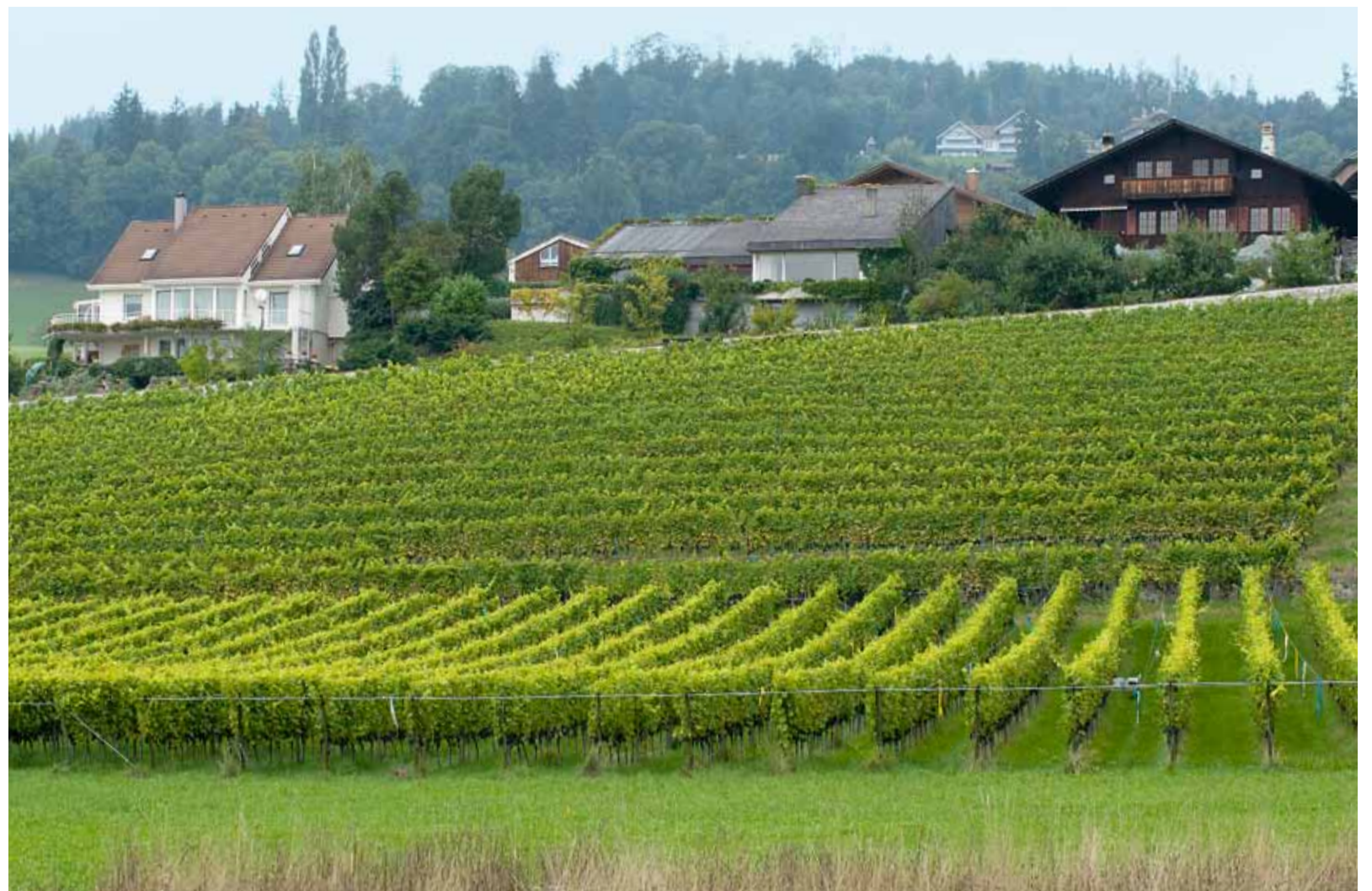
Herbstzeit – Erntezeit. «Was der August nicht kocht, kann der September nicht braten!»

(Bilder: aus dem Jubiläums-Burgerspiegel der Burgergemeinde Steffisburg, 2010)