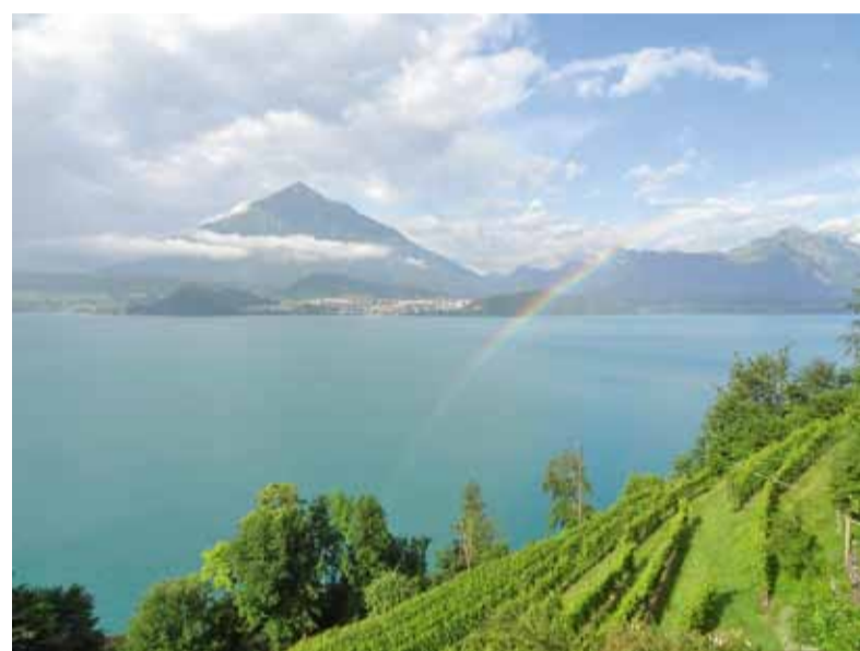
Blick zum Niesen vom Rebbau in Ralligen (zwischen Gunten und Merligen) aus.

Rebbaugenossenschaft Spiez – Rebbaugenossenschaft Oberhofen – Rebbaugenossenschaft Stampach-Merligen – Rebbaugenossenschaft Hilterfingen – Rebbau Peter Gerber Thun – Rebbau Jaun, Brändlisberg Steffisburg – Rebbau Steffisburg, Ortbühl, Steffisburg – Weinmanufaktur Rindisbacher Bern und Seftigen – Rebbaugenossenschaft Reichenbach, Zollikofen.