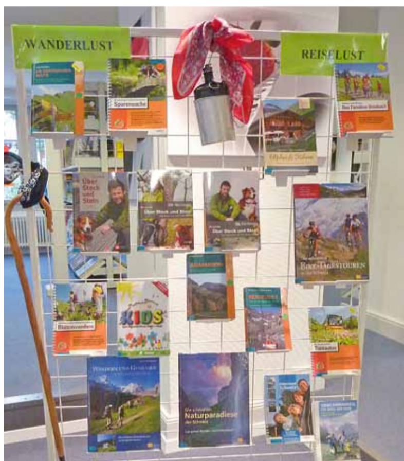
«Chömet cho luege» in die Gemeindebibliothek, Oberdorfstrasse 30, 3612 Steffisburg.