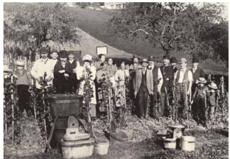
Der letzte öffentliche Weinleset im Dorf fand um 1905 in der Walke statt.