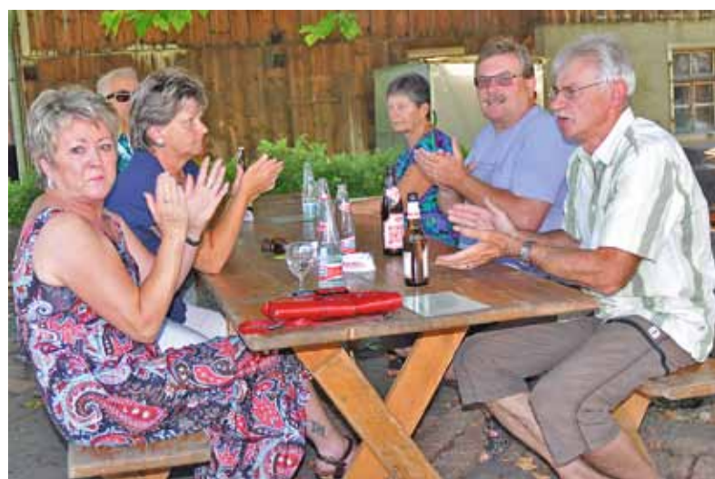
Gemütliche Stimmung unter den anwesenden Dorfleistfest-BesucherInnen.