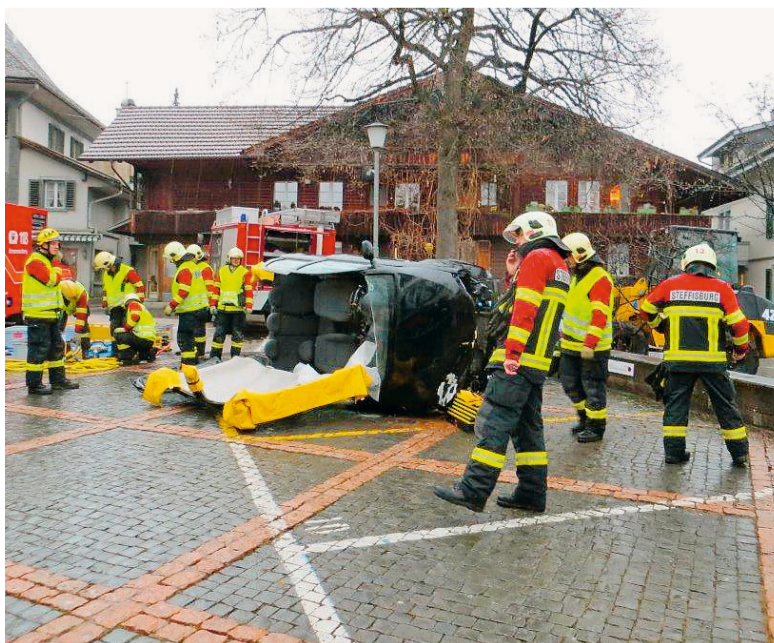
Eindrückliche Zusammenarbeit des Feuerwehr-Teams. Die Bergung der verunfallten Person dauerte bei beiden Demonstrationen rund 15 Minuten.