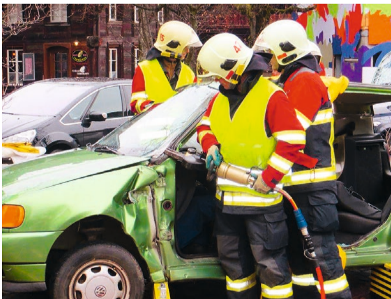
Türen und Dach werden mit einer hydraulischen Schere abgetrennt...