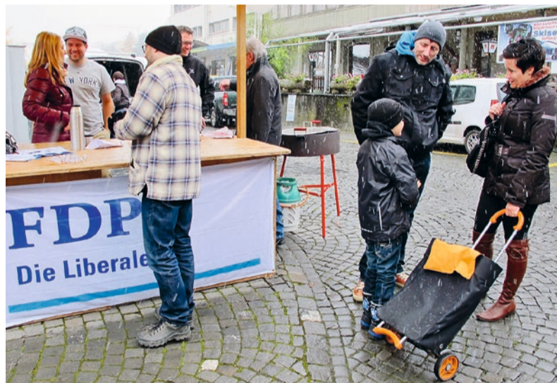
Der traditionelle Marronistand der FDP.Die Liberalen Steffisburg bot Gelegenheit, interessante Gespräche zu führen.

Mit einer kleinen Tüte der heissen Herbstleckereien liess sich denn auch manche Passantin und mancher Passant in ein interessantes Gespräch verwickeln. Dabei streuten die Themen sehr breit. So wurde über die Politik auf Bundesebene, über ganz unterschiedliche, parteipolitische Grundsätze aber auch über sehr persönliche Anliegen der Steffisburgerinnen und Steffisburger diskutiert. Natürlich waren für die FDPler vor allem die konkreten Anregungen und die teilweise auch kritischen Überlegungen zur Lokalpolitik von besonderer Bedeutung. Schlussendlich ging es bei dieser Marroni-Standardaktion darum, den Puls der Bevölkerung zu spüren und damit gute Grundlagen für die Arbeit in der Gemeindepolitik zu gewinnen.