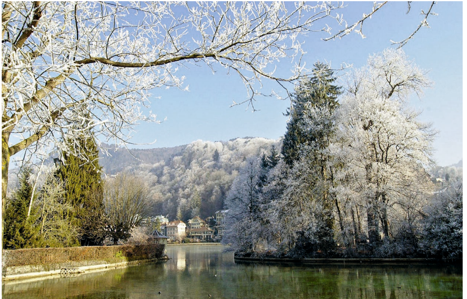
Der morgendliche Reif bedeckt die Äste der Bäume auf der Aareinsel (rechts) in Thun wie Zucker. Die kleine Insel ist heute in Privatbesitz und nicht mehr öffentlich zugänglich. Der grosse Schnee ist in den unteren Lagen – und vor allem auf der Alpennordseite – noch nicht gefallen. Die vielen Wintersportfans hoffen natürlich, dass sich dies auf die Sportferien von nächster Woche ändern wird. Das relativ milde Wetter, welches momentan vorherrscht, lädt dafür zu schönen Spaziergängen in tiefere Regionen ein.

Geschäftsstelle, Postfach 2607, 3601 Thun Telefon 033 341 12 78 Fax 033 437 90 77