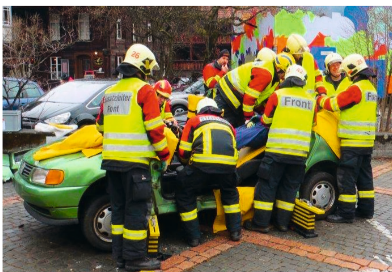
...damit die verletzte Fahrzeuginsitzerin aus der misslichen Lage befreit werden kann.