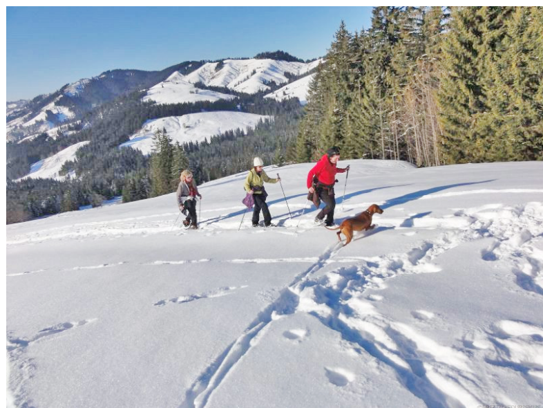
Die voralpine Region Eriz eignet sich bei entsprechenden Verhältnissen sehr gut für das Wandern mit Schneeschuhen.