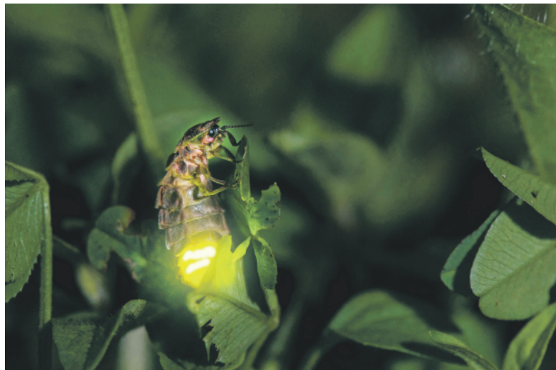
Das leuchtende Glühwürmchen-Weibchen ist auf Partnersuche.

Unsere Tierwelt ist eine Welt der Insekten. Von rund 36 000 in der Schweiz bekannten Tierarten gehören 30 000 zu den Insekten. Wo es den Insekten gut geht, ist die Natur in Ordnung. Doch die Wunderwelt der Insekten zerfällt in beängstigender Geschwindigkeit. Lebensraumzerstörung, Pestizide, Lichtverschmutzung und andere Faktoren setzen ihr zu. Die Folgen für Natur und Mensch sind schwerwiegend. Auf diese Probleme, aber auch auf praktische Lösungen wirft das Glühwürmchen 2019 sein magisches Licht. pd/sku