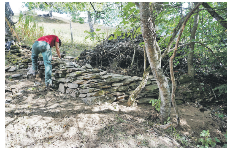
Trockenmauer erhält vom Förster noch den letzten Schliff.