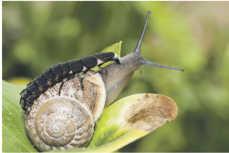
Die Hauptbeute der Glühwürmchenlarve sind Schnecken.