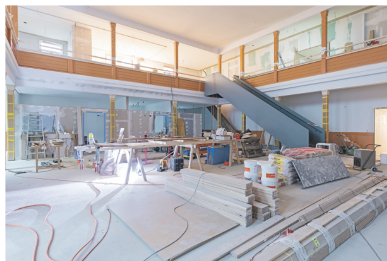
Empfang MediZentrum (ehemaliger Saal).