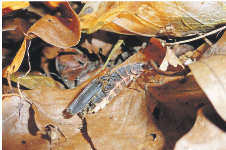
Das Glühwürmchen bei der Paarung.