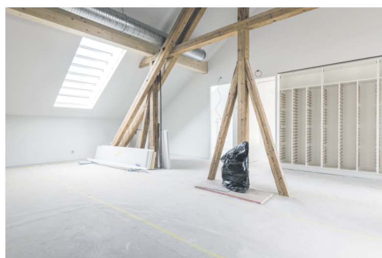
Physiotherapie im Dachgeschoss.