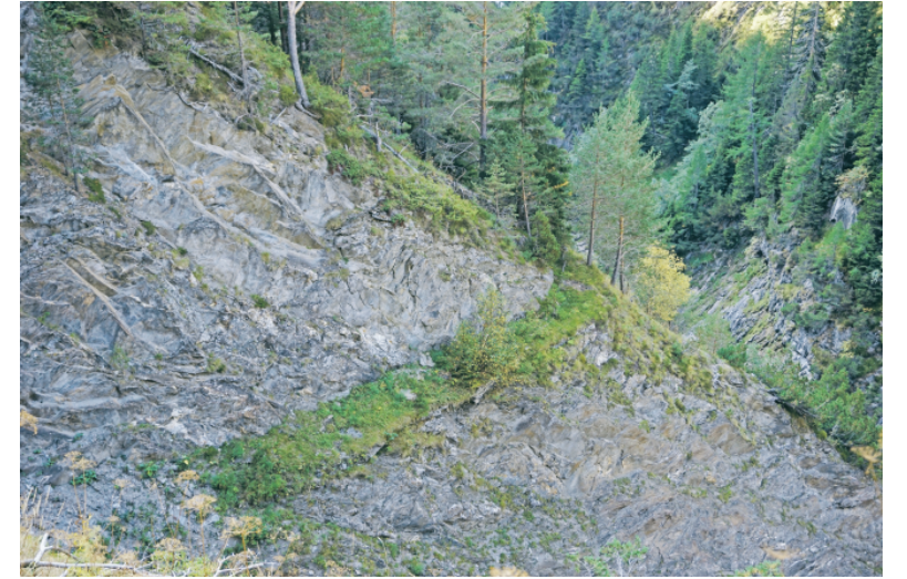
Alter Verkehrsweg zwischen Ausserbinn und Binn in der Twingi-Schlucht.