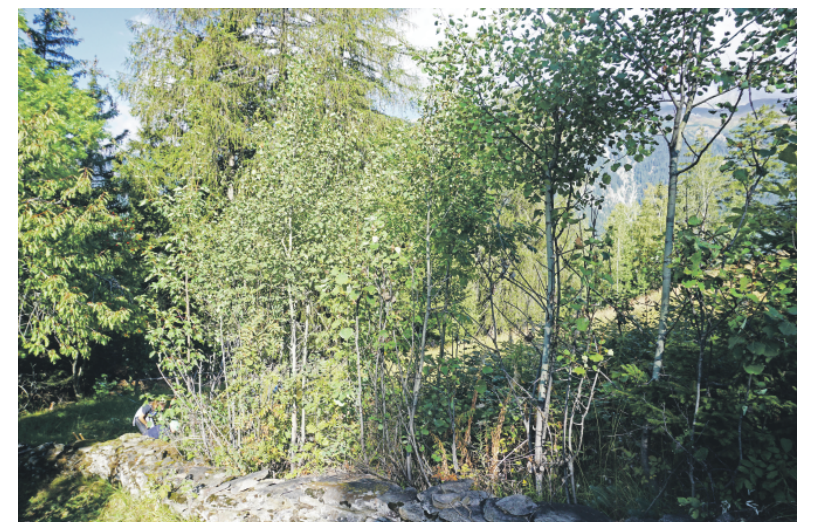
Vergandeter Teil der Alpweide – dieses Stück mit Jungbäumen wurde gerodet.

Am selben Arbeitsplatz galt es für eine dritte Gruppe, die vergandete Alpweide von Jungbäumen zu befreien. Der Begriff «verganden» bedeutet, dass der Wald langsam die kultivierten Alpweiden zurückerobert. Die Jungbäume mussten nicht nur gefällt, sondern ihr Wurzelstock musste so gut wie möglich aus der Erde ausgegraben werden, da ansonsten der Wurzelstock innert kürzester Zeit wieder ausgeschlagen hätte.