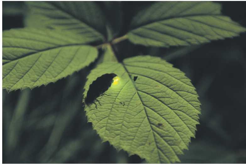
Licht im Dunkeln: Leuchtendes Glühwürmchen-Weibchen.