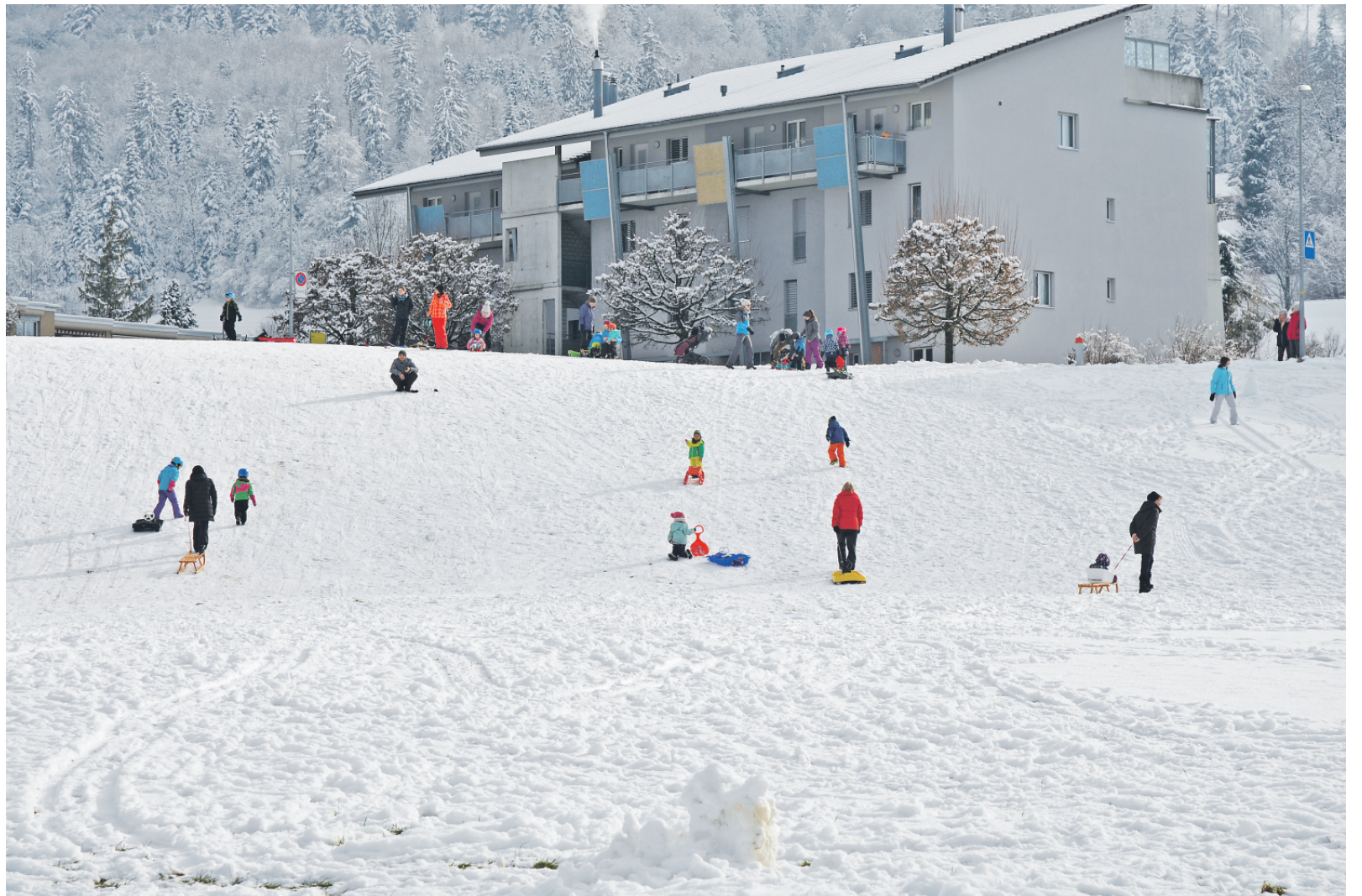
Anfangs Februar hatte der Winter die Region im Griff. Die weisse Pracht wurde jedenfalls am bekannten Schlittelhügel in der Erle in Steffisburg von klein und gross sofort und rege genutzt.